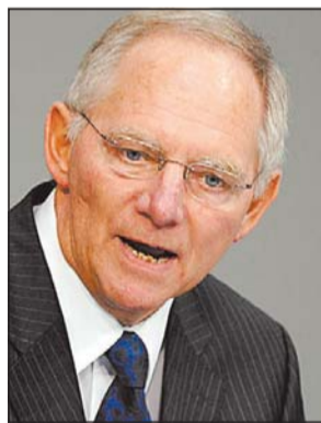
Finanzminister Wolfgang Schäuble: leere Kassen.

Die FDP reagierte verärgert auf die neuen Angriffe aus der Union. »Wenn